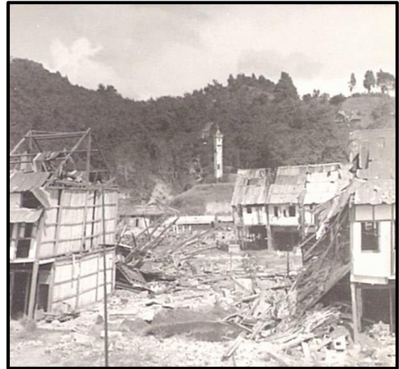
Sumber: Jurnal Encyclopedia of Malaysia 1940-2006